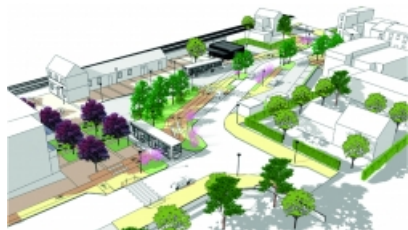
Printemps - Eté 2019

Les travaux sous maîtrise d'oeuvre et maîtrise d'ouvrage de la Communauté d'agglomération Val Parisis ont pour but d'aménager le pôle gare de Bessancourt suivant l'aménagement de l'éco-quartier de la ville. Le projet consiste à embellir ce quartier et proposer aux habitants davantage de commodités.